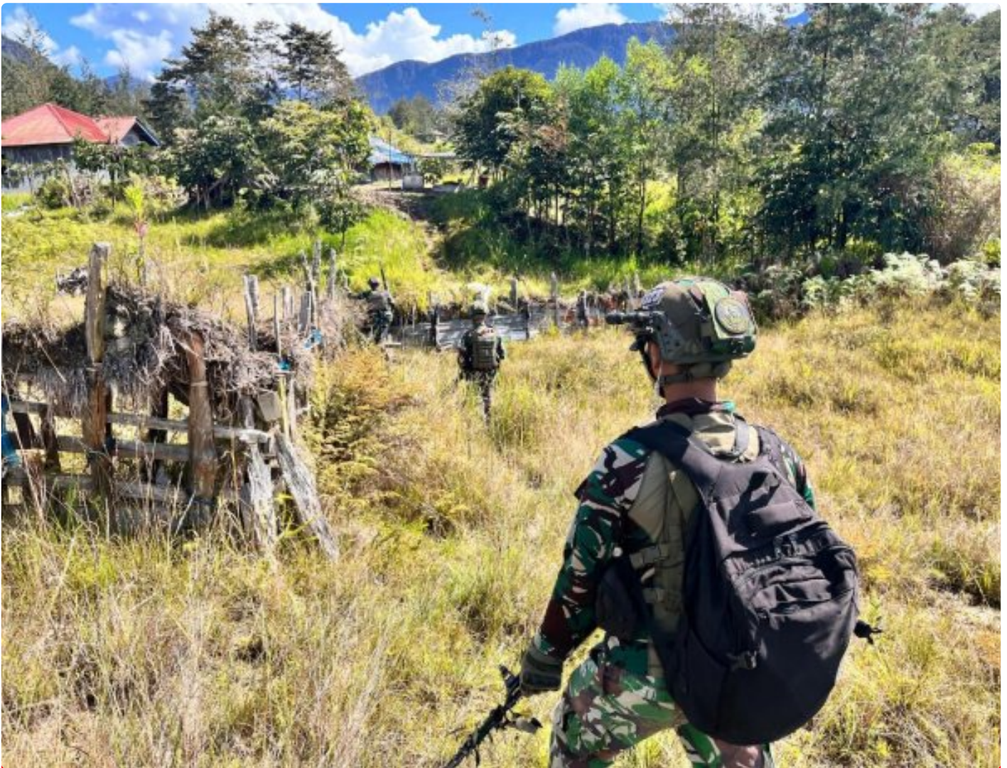
Satgas Mobile Yonif 323 Buaya Putih melaksanakan Patroli Komsos

Satgas Yonif 323 Buaya Putih Kostrad pada saat melaksanakan patroli menjaga keamanan di sektor wilayah tanggungjawabnya di wilayah kampung Gigobak,